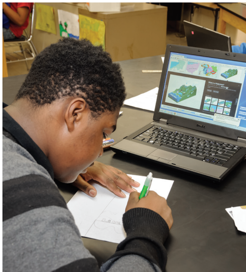
Career Pathways and/or Curriculum are subject to change.

Garrett Morgan's emphasis on healthy living for students, staff and the community has earned it Ohio's first-ever national gold-award in the Healthy Schools Program since it was launched in 2006. The program evaluates the ways schools promote nutrition, health education and physical activity and create a healthy environment for students and staff.